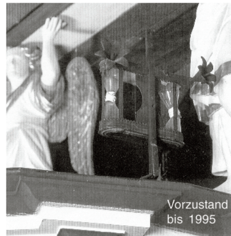
Vorzustand bis 1995